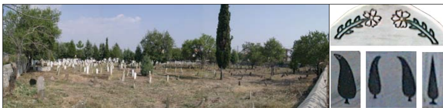
Εικόνα 3. Αριστερά: άποψη του νεκροταφείου του Yeni Mahalle στην Κομοτηνή. Δεξιά: Τυπικό σκαλιστό μοτίβο επιτύμβιων στηλών.

Το μουσουλμανικό νεκροταφείο το οποίο αποτυπώθηκε στα πλαίσια του προγράμματος ήταν το Yeni Mahalle (καινούρια γειτονιά) στην πόλη της Κομοτηνής. Το νεκροταφείο βρίσκεται στην βόρεια πλευρά της πόλης και αποτελείται από περίπου 784 τάφους. Είναι χωρισμένο σε τρία μέρη. Έχει μια μικρή είσοδο με ένα μικρό αποθηκευτικό χώρο στα δεξιά της εισόδου και δίπλα από αυτόν βρίσκεται ο τάφος του δωρητή του οικοπέδου για την δημιουργία του νεκροταφείου. Στην συνέχεια και αμέσως μετά από ένα πολύ μικρό περιβόλο, στη συνέχεια από την είσοδο, συναντάμε τους πρώτους τάφους και το κύριο τμήμα του νεκροταφείου (Εικόνα 3.). Το τρίτο και τελευταίο μέρος είναι η σημερινή προέκταση του νεκροταφείου. Οι τάφοι αποτελούνται από μάρμαρο, τσιμέντο ή πέτρα και είναι προσανατολισμένοι προς την κατεύθυνση της Μέκκα. Ο κάθε τάφος περιλαμβάνει 2 επιτύμβιες στήλες οι οποίες είναι γραμμένες στα αραβικά ή στα σύγχρονα τουρκικά. Οι σχετικές πληροφορίες που συλλέχθηκαν συμπεριλαμβάνουν το όνομα, ηλικία και επάγγελμα των θανόντων, ημερομηνία γέννησης και θανάτου, αιτία θανάτου, τόπος διαμονής και καταγωγής.