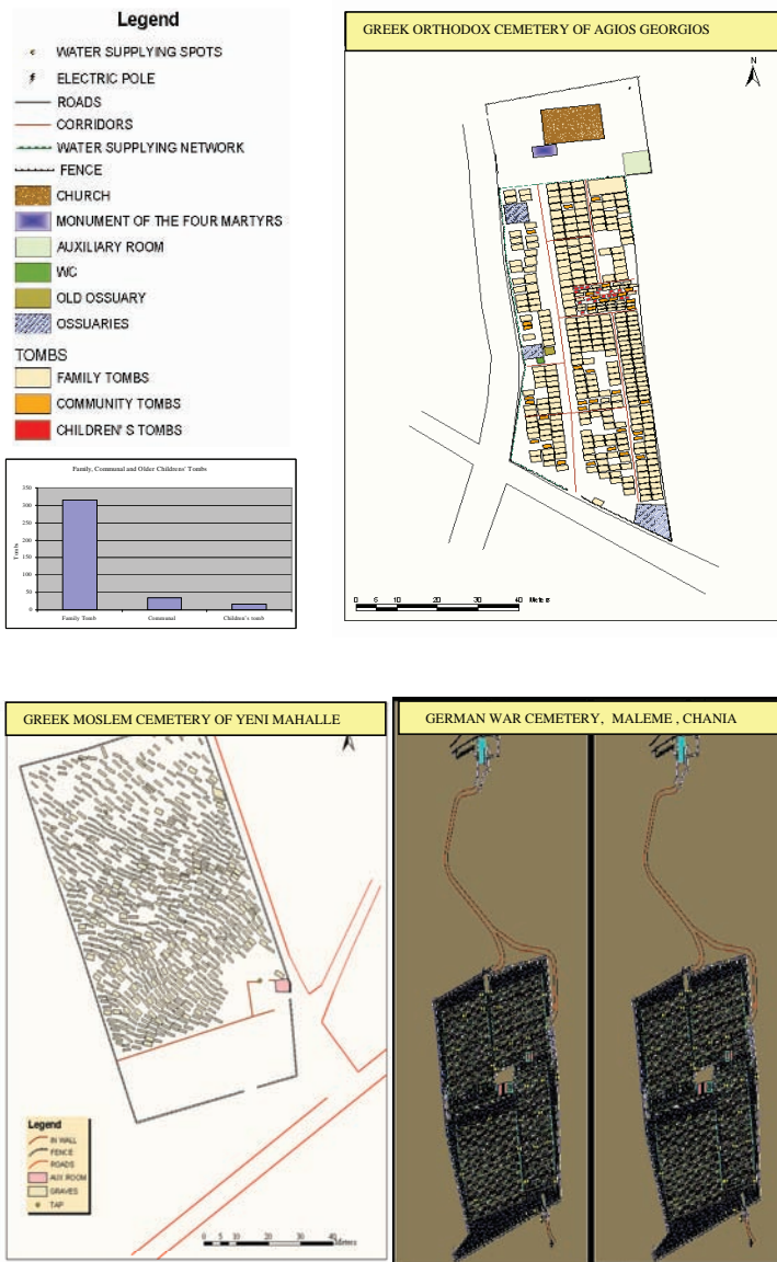
Εικόνα 4. Αποτελέσματα της χαρτοσύνθεσης σε περιβάλλον GIS των πιλοτικών νεκροταφείων που χαρτογραφήθηκαν στα πλαίσια του προγράμματος e_MEM.